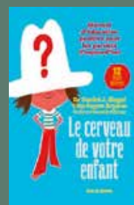
Dr D. Siegel & T. Bryson. LE cerveau de votre enfant. Editions Poche Marabout